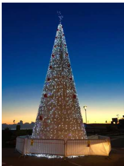
l'albero di Natale di piazzale Zenith, Bibione