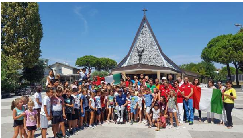
Gr.Est. 2018, viaggio-esperienza a Cracovia, per gli animatori jr