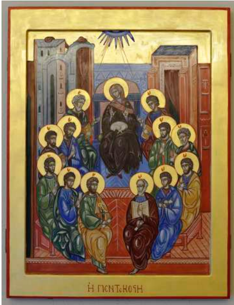
Icona della Pentecoste, discesa Spirito Santo (chiesa)