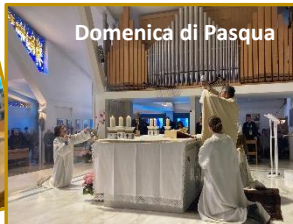
Domenica di Pasqua