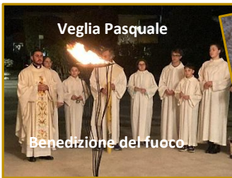
Veglia Pasquale Benedizione del fuoco