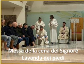
Messa della cena del Signore Lavanda dei piedi