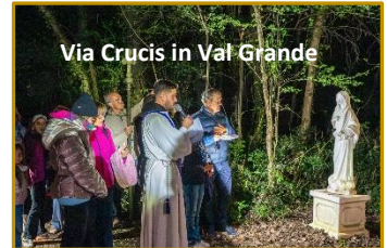
Via Crucis in Val Grande