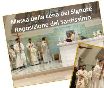
Messa della cena del Signore Reposizione del Santissimo