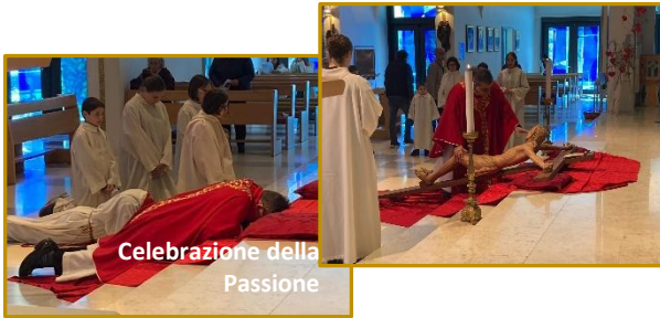
Celebrazione della Passione